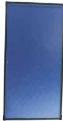
SOLATRON S 2.5-1 V (vertikal)

Der Schlüssel für die optimale Warmwasserbereitung und Heizungsunterstützung mit Hilfe der Sonne liegt in der perfekten Abstimmung der Komponenten. ELCO bietet Ihnen komplette Solarsysteme. Dazu zählen Solar-, Brauchwasser- und Pufferspeicher in vielen verschiedenen Größen für eine optimale Auslegung der Solaranlage an Ihre Anforderungen. Pufferspeicher können die erzeugte Wärme über längere Zeiträume speichern. Solarregler sorgen dafür, dass die auf dem Dach gewonnene Wärme so effektiv wie möglich genutzt werden kann. Dazu kommt eine spezielle ELCO Pumpengruppe als Basis- und Kaskadenmodul.