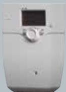
Solarregler LOGON B SOL