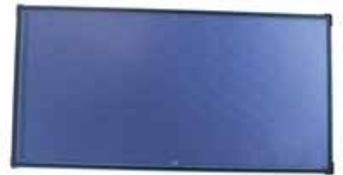
SOLATRON S 2.5-1 H (horizontal)